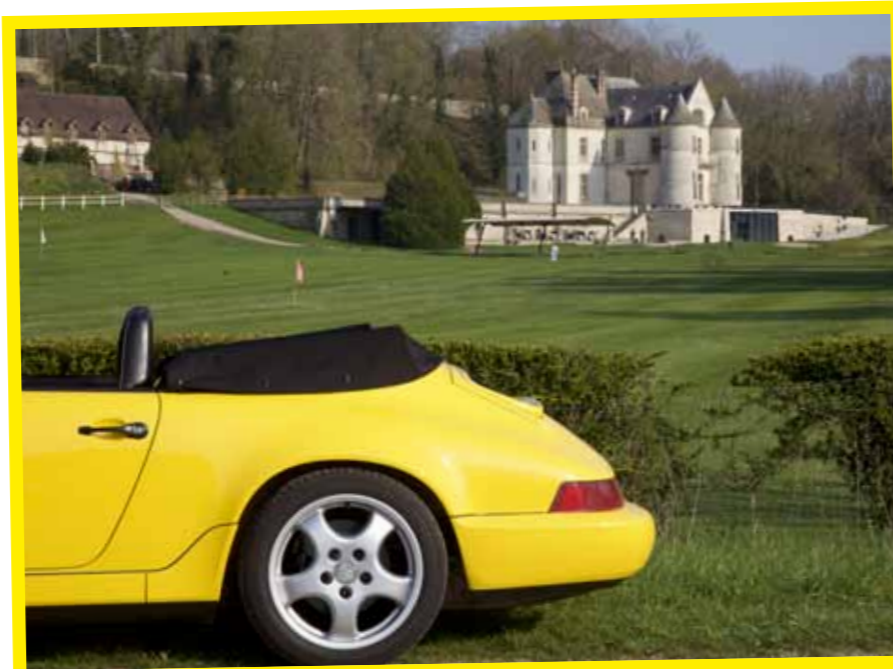
Km 207 DOMAINE DE VILLARCEAUX

Je continue donc d'enchaîner des départementales qui vont bien, avec régulièrement des enchaînements de virages. Rien de très spectaculaire, mais largement de quoi se faire plaisir, surtout que nous sommes ici hors des sentiers battus, contrairement à la vallée de Chevreuse que nous rejoindrons plus tard. Les revêtements ne sont pas toujours parfaits, ce qui me permet de mesurer le chemin parcouru côté rigidité sur les cabriolets 911. La 964 était pourtant une référence, par rapport à ce qui se faisait à l'époque, mais quand on roule aujourd'hui sur mauvaises routes, on sent quand même quelques trépidations qui nous ramènent au début des années 90. Elles sont ici d'autant plus perceptibles que la vitre passager a tendance à vibrer un peu sur les bosses. Sinon, elle a tout bon, elle est très saine, très propre, son freinage est parfait (trop parfait même, la pédale ne descend pas et le talon-pointe est impossible), et les enchaînements se passent comme par enchantement. Modèle charnière entre les anciennes et les modernes, la 964 a tout d'une moderne, question assistances diverses, mais renvoie à des