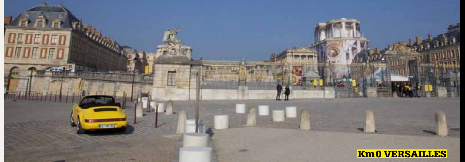
Km 0 VERSAILLES

pour le prêt de cette 964, entièrement repeinte il y a un an, et n'ayant que 126 000 km. Une paille. Sinon, faut-il vraiment vous décrire le château de Versailles ? Le plus grand et le plus fastueux château du monde... Né de la volonté de Louis XIV, il vit aussi Louis XV et Louis XVI y vivre, jusqu'à ce que... Ce qui est étonnant, au-delà de son immensité, c'est la manière dont il a été préservé et a survécu au temps. D'importants travaux y ont bien sûr été accomplis, afin de le restituer au mieux, mais quand on s'y promène, on s'attendrait vraiment à voir surgir le roi soleil avec Madame de Maintenon, Louis XV et la Comtesse du Barry, ou Louis XVI et Marie-Antoinette. Peut-être ai-je trop regardé la série "Versailles" ? (quel dommage qu'elle se soit arrêtée, soit dit en passant...).