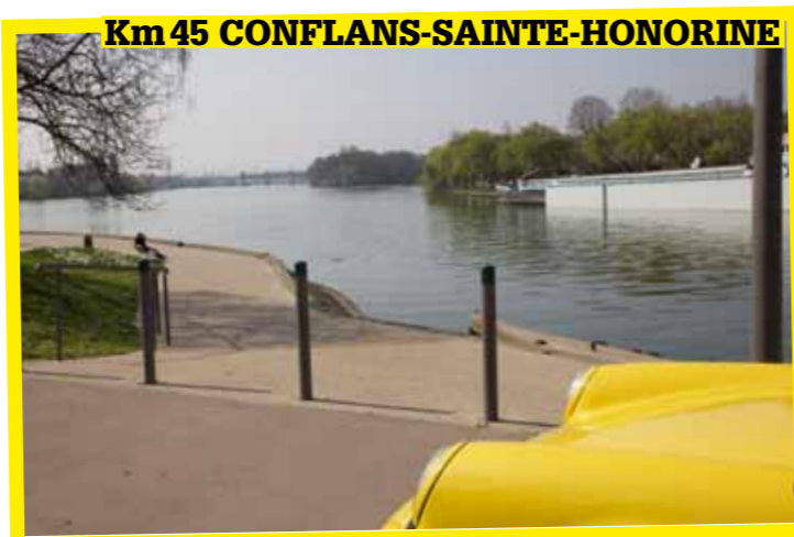
Km 45 CONFLANS-SAINTE-HONORINE

confort. Quant à Conflans-Sainte-Honorine, tous ceux qui fréquentent la N184 en connaissent l'image traditionnelle, vue du pont routier : une petite ville en bord de Seine, avec ses péniches et sa petite église, qui invite à faire une pause, que, hélas, la plupart ne feront jamais. Il fait pourtant bon s'y promener, et aller jusqu'ici, à la confluence entre l'Oise (qui arrive à droite) et la Seine (qui arrive à gauche). Un lieu bien paisible !