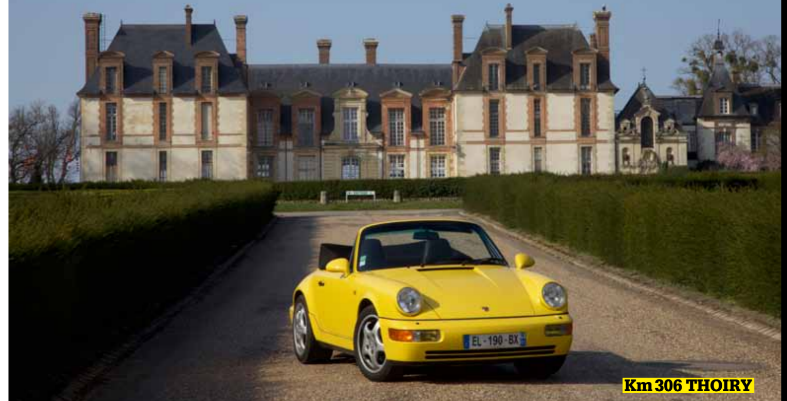
Km 306 THOIRY