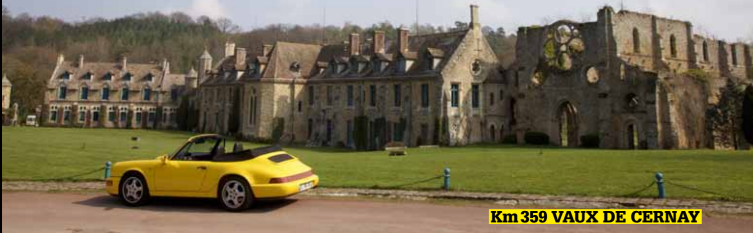
Km 359 VAUX DE CERNAY

splendide hôtel haut de gamme où je rêve de dormir un jour. Ce décor, vous l'avez assez souvent vu dans Flat 6, car nous aimons aller y photographier des Porsche. La 964 s'y fond admirablement. Elle reste aujourd'hui la génération préférée de tous ceux qui veulent la plus moderne (techniquement) de toutes les 911 avec les ailes avant d'origine, les fameux yeux de grenouille. Esthétiquement, une vraie réussite, mais existe-t-il une 911 qui ne soit pas digne d'admiration ?