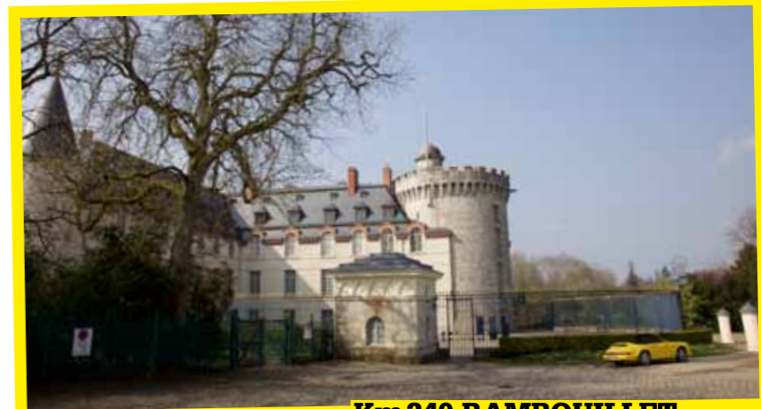
Km 340 RAMBOUILLET

Tiens, encore un château ! Donc encore un morceau d'histoire. Ici, c'est François 1er qui s'est éteint (dans la tour, dit-on), mais chaque château a une somme de choses à raconter. Combien de jours faudrait-il pour prendre le temps de tous les visiter, tous ces hauts lieux que nous vous présentons ce mois-ci ? Rien que pour Versailles, il faut au moins deux jours... De Rambouillet, on retiendra aussi son parc, et bien sûr son immense forêt. Amusant de voir ce que chaque département peut offrir, au fil de nos voyages... Tiens au fait, et cela n'a rien à voir, mais j'en profite pour glisser un petit mot sur mes observations au cours de ces derniers mois sur toutes sortes de routes en France : contrairement à ce qu'on veut nous faire croire, je n'ai noté aucune modification notable du comportement des français au volant, qui continuent, dans leur immense majorité, de rouler sous les 80 km/h, radars détruits ou pas. A de rares exceptions, je vois toujours tout le monde freiner devant les radars. Du coup, quand je lis dans le communiqué de la Prévention Routière, que la forte hausse du nombre de tués en février (plus 17%) est due aux français, chauffards en puissance, qui roulent tous plus vite à cause de la destruction des