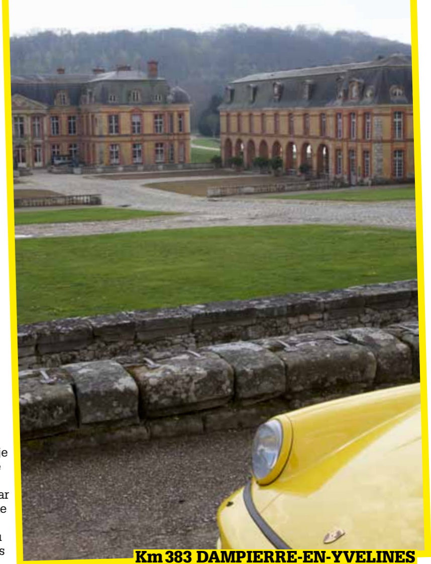
Km 383 DAMPIERRE-EN-YVELINES