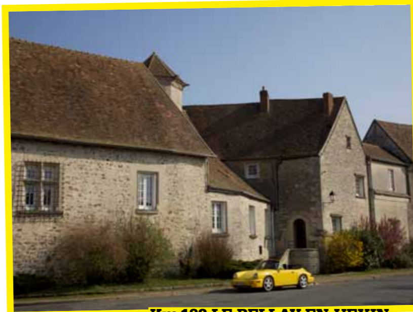
Km 183 LE BELLAY-EN-VEXIN

Oh, les amis, vous avez vu la longueur du road-book depuis Auvers ? Cette fois, tout bascule ! Parlons du parcours, d'abord : jusqu'à St-Leu, c'est toujours la punition, puis, enfin, on se retrouve dans la campagne avec de jolies petites routes, mais encore quelques agglomérations à traverser, avec deux points forts à ne pas rater (impossible d'y faire des photos, hélas), le château d'Ecouen et la magnifique abbaye de Royaumont. Puis vous vous laissez glisser jusqu'à la jolie petite ville de l'Isle-Adam, et c'est vraiment à partir de là qu'arrive le plaisir de conduite, car on rentre dans le Vexin français. D'où mon avertissement du départ : si vous ne cherchez dans ces deux départements que l'aspect purement balade sur petites routes, démarrez à l'Isle-Adam ! A partir de là, on retrouve cette France qu'on aime, celle des petites routes désertes serpentant dans de beaux paysages. Et c'est vrai qu'il est tout beau, ce Vexin français, plein de douces collines et parsemé de villages où l'on trouve, entre autres, de grands corps de