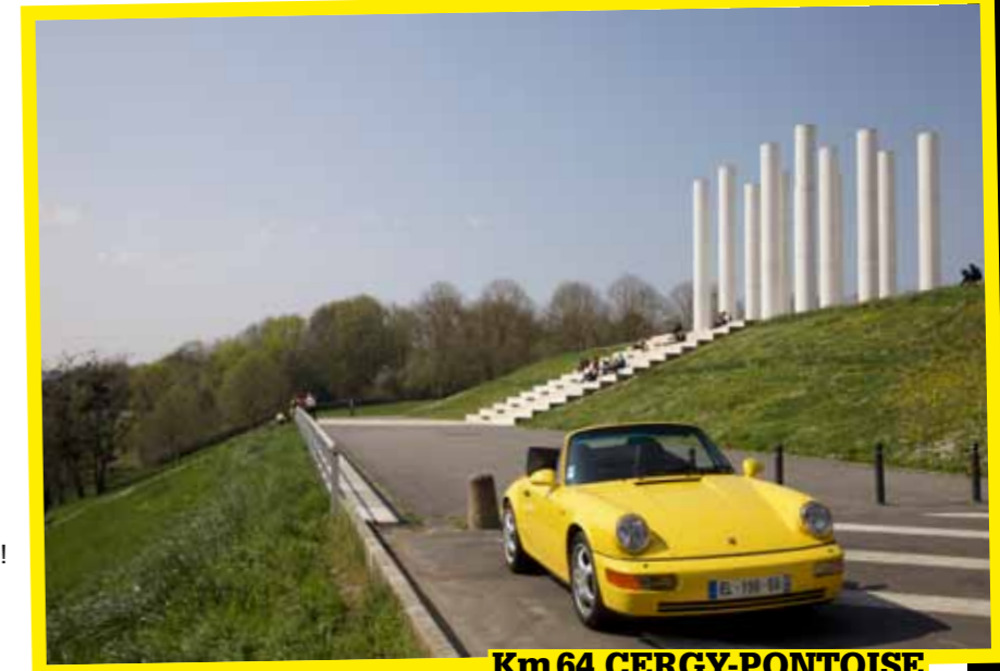
Km 64 CERGY-PONTOISE

Nombreux sont ceux qui pensent que Cergy-Pontoise, ville moderne, ne présente aucun intérêt. Ils ont tout faux : on y trouve en effet un "axe majeur", une longue promenade de 3 km remplie de sculptures et de lieux originaux, s'achevant ici par l'esplanade de Paris, offrant une vue imprenable sur la capitale, droit sur les tours de la Défense. On doit cet ensemble, qui date de 1980, au sculpteur Dani Karavan. Vous aurez noté que nous abordons le département du Val d'Oise ! Côté conduite, ce n'est sûrement pas entre la N184 et le petit bout d'A15 que notre 964 va commencer à s'exprimer. Sur ce point, il faudra un peu de patience... Pour le moment, je constate juste que nous avons un peu trop perdu l'habitude de rouler sans filet anti-remous. Il fait 14-15 degrés, mais en ce tout début avril, le fond de l'air est encore frais, et dès qu'on roule ouvert à plus de 100, on sent cet air revenir par l'arrière. Cela oblige à rouler