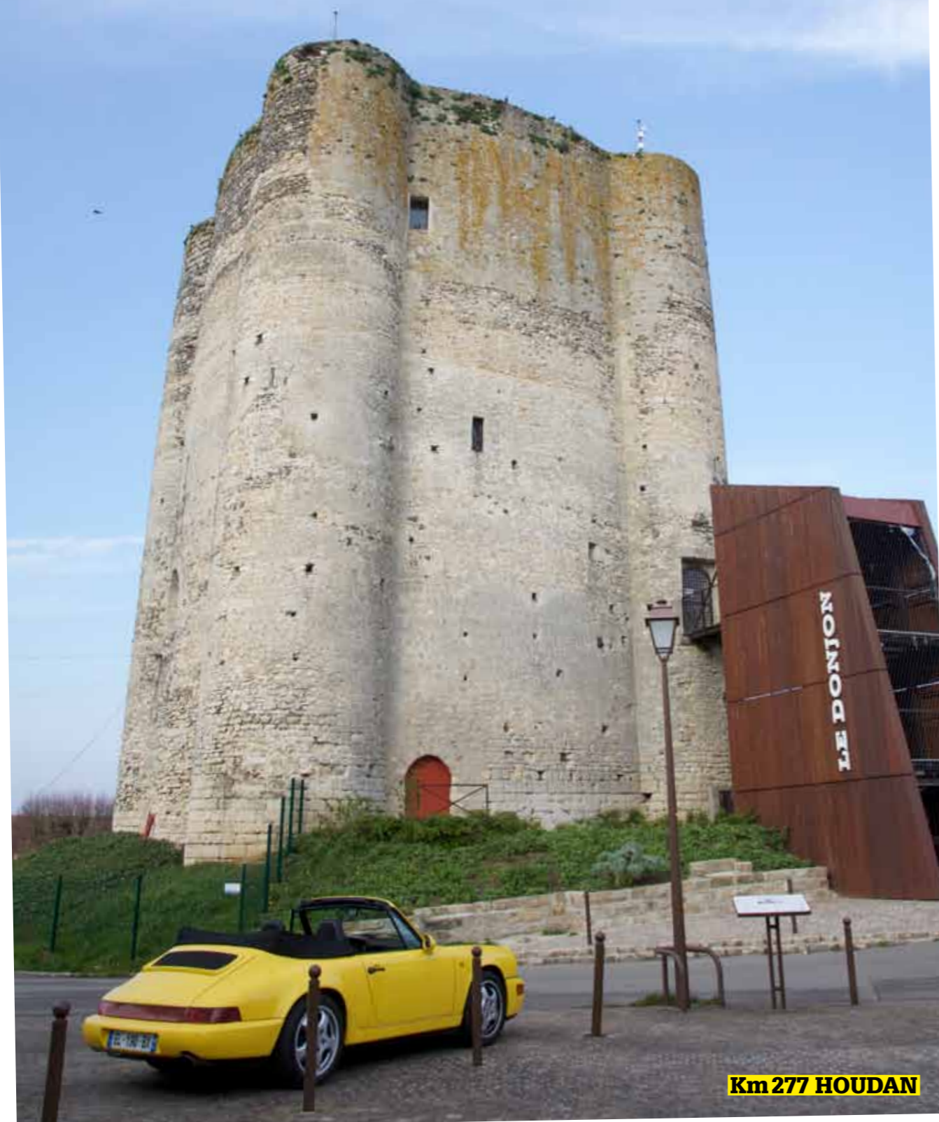
Km 277 HOUDAN