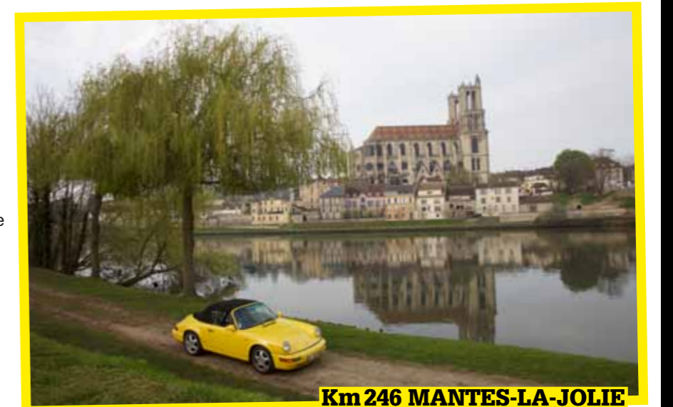
Km 246 MANTES-LA-JOLIE

voyage sans le plaisir de conduire une Porsche ? Tout est tout de suite plus beau, et bien plus riche. Le mélange de sensations permet de sublimer la route et la notion même de voyage. Quand je pense à tous ceux, trop nombreux hélas, qui roulent très peu avec leur Porsche, ils ne savent pas ce qu'ils ratent. Si des parisiens me lisent ici, qu'ils prennent le temps de faire ce beau voyage tout près de chez eux !