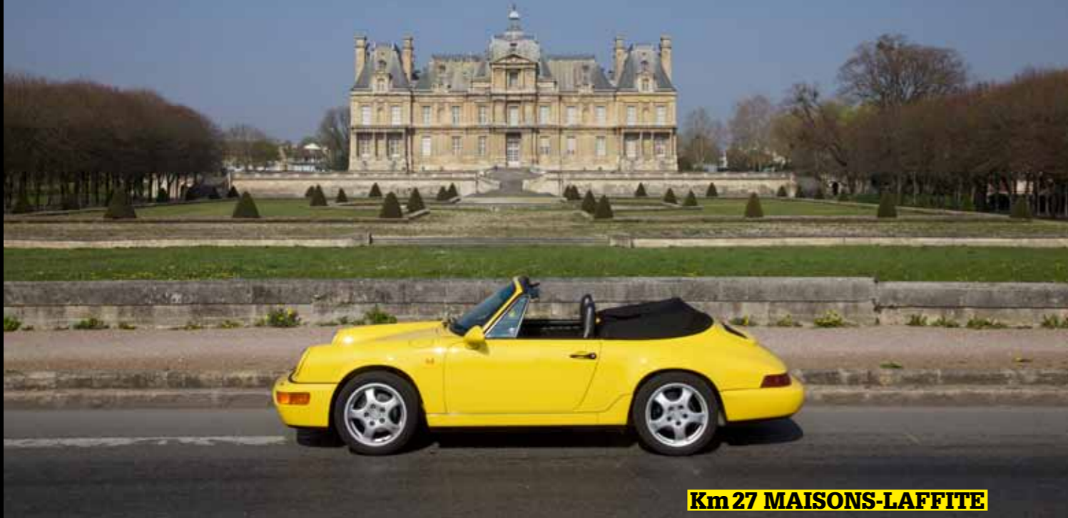
Km 27 MAISONS-LAFFITE