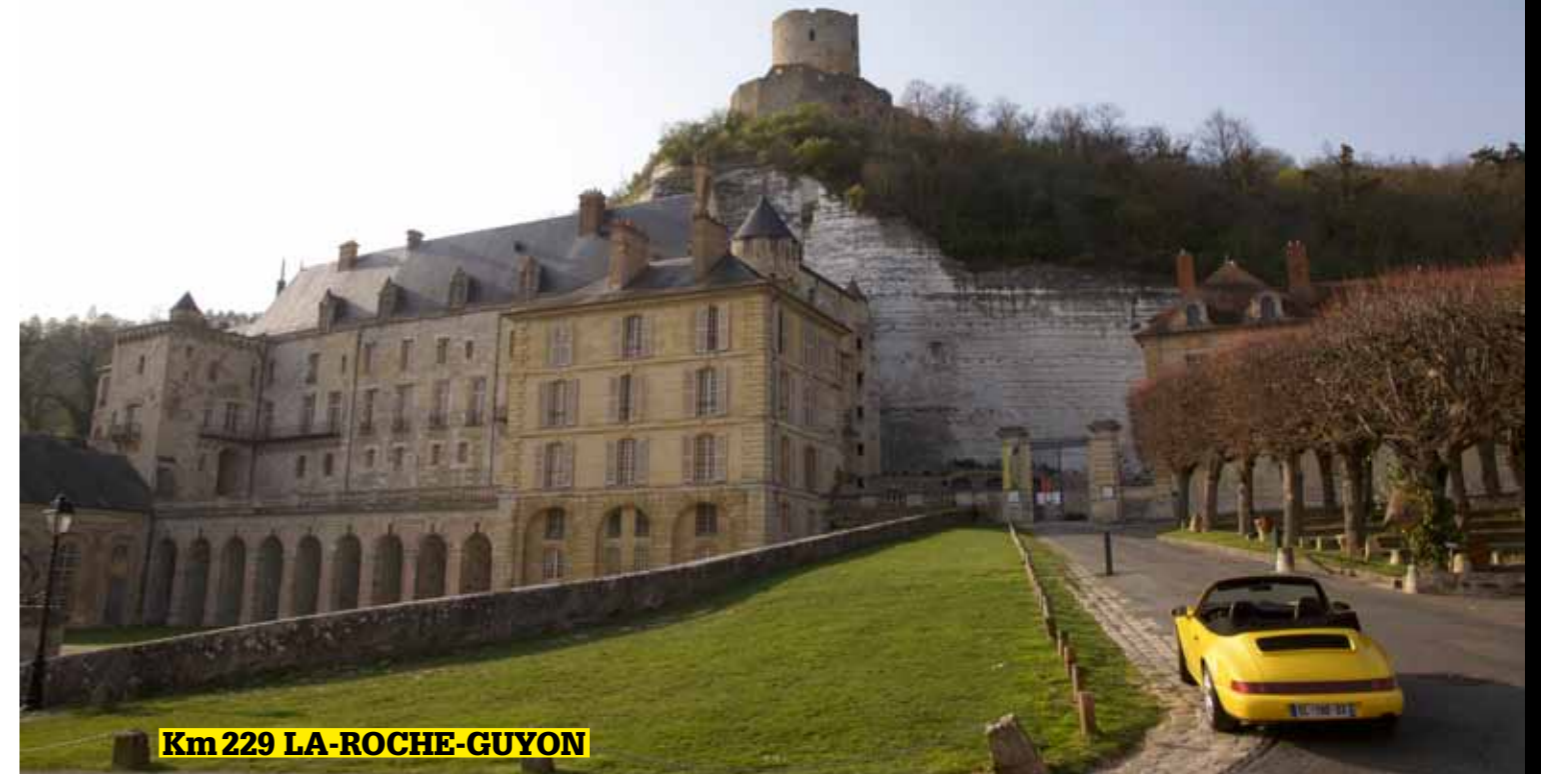
Km 229 LA-ROCHE-GUYON

trouver un hôtel pour la nuit. Je ne ressens pourtant pas de fatigue, ni la 964, mais il faut bien s'arrêter. Cette nuit, je pourrai dormir en me berçant de la musique de son flat 6, encore améliorée par un pot Cup Scart. Amusante coïncidence, puisque le guide d'achat de ce mois-ci parle d'une 993 également modifiée sur ce point par Scart. Et dans les deux cas, avec une belle réussite, car le son est encore plus beau, sans être envahissant.