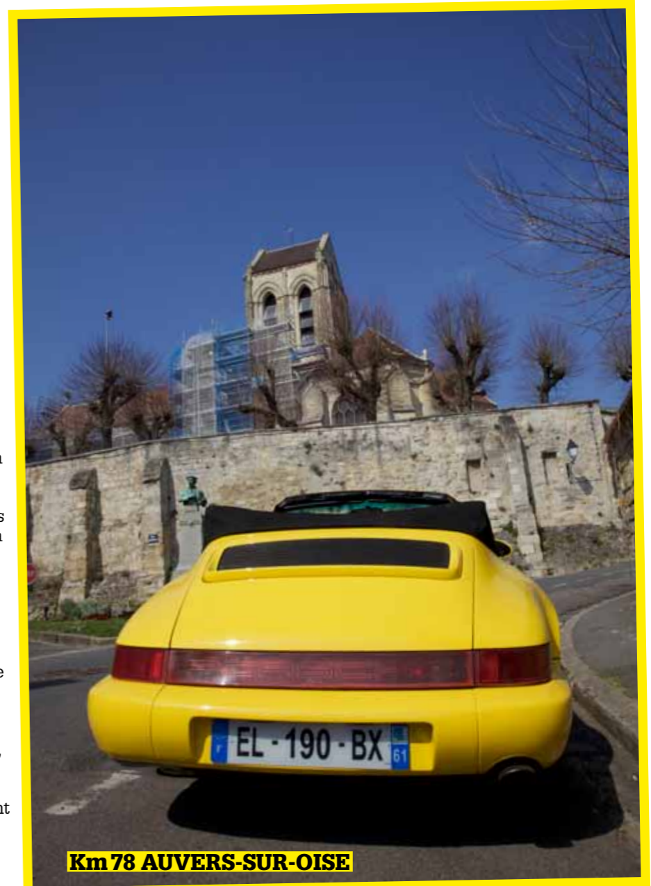
Km 78 AUVERS-SUR-OISE

Pour arriver jusque là, je suis passé par la ville de Pontoise, plutôt jolie car traversée par l'Oise, et j'ai cru bien faire en prenant la D4 qui longe le fleuve. Au début, c'est mignon, mais l'arrivée dans Auvers est très pénible, la route, étroite, ne permettant pas de se croiser, et comme si cela ne suffisait pas, des ralentisseurs ont été ajoutés. Encore... Je prends mon mal en patience, d'autant que "ma" 964 trépigne de se dégourdir les roues.