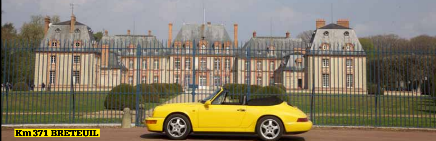
Km 371 BRETEUIL

le tempérament n'est pas celui d'une ultra-sportive, mais d'une grand tourisme ne demandant qu'à faire preuve de sportivité. La boîte cinq (j'ai failli plusieurs fois mettre une sixième sur les grands axes) est rapide et précise, du moins pour son époque, tout semble bien plus facile qu'avec une 3.2, mais attention quand même à ne pas se laisser porter par la griserie : comme évoqué plus haut, emmenée aux limites, une 964 demande un peu de métier et ne permet pas de faire n'importe quoi. C'est aussi pour cela qu'on l'aime !